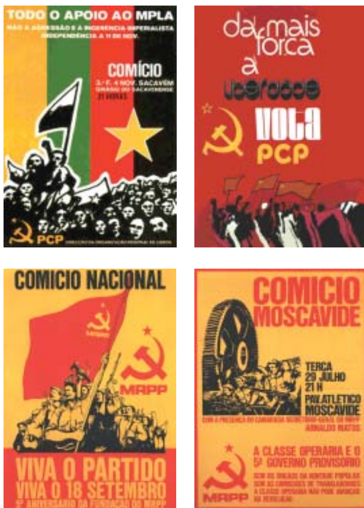
Fig. 7 - A nível iconográfico, a retórica do ‘meeting’ e a retórica da ‘guerra’, reflectem-se também na forma como a comunidade política é retratada. No âmbito da retórica do ‘meeting’, recorre-se igualmente, à representação de toda uma cinética do contacto físico: o braço aberto que abraça, a mão que aperta a outra mão, o braço entrelaçado, etc..