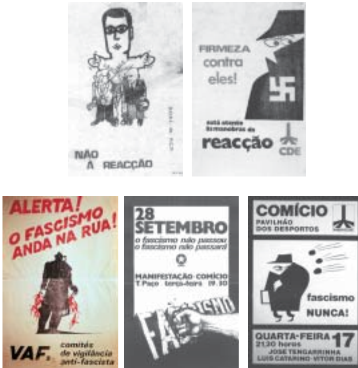
Fig. 4 - Da esquerda para a direita e de cima para baixo: cartaz C - 'Não à reacção' - DORL do PCP; cartaz D - 'Firmeza Contra Eles!' - MDP-CDE; cartaz E - 'Alerta! O Fascismo Anda na Rua?' - VAF; cartaz F - '28 de Setembro. O Fascismo Não Passou. O Fascismo Não Passará' - GDUP; cartaz G - 'Fascismo Nunca!' - MDP-CDE.