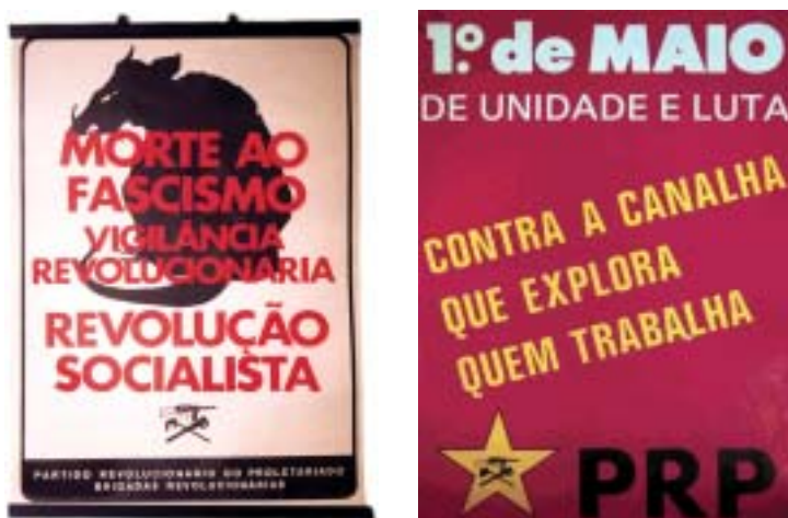
Fig. 10 - A invectiva a nível verbal e iconográfico. Saliento que a silhueta do rato, entendida como metáfora iconográfica do fascismo, é um motivo copiado de uma serigrafia de um cartaz francês relativo aos acontecimentos de Maio de 1968 ( Vermine Fasciste. Action Civique ). Este cartaz é duplamente relevante, porque não só é demonstrativo da possibilidade de se desenvolverem invectivas a nível iconográfico, como também das influências estéticas subjacentes à produção cartazística do pós 25 de Abril.

GASQUET, Vasco – Les 500 Affiches du Mai de 68 . Paris, Balland, 1979.